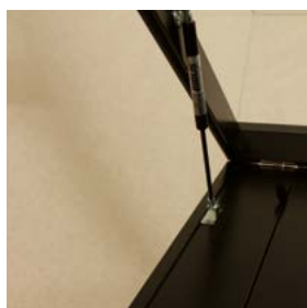
Vérin à gaz